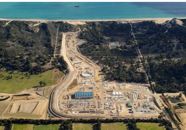
Southern Seawater Desalination Plant, Perth (Australien)